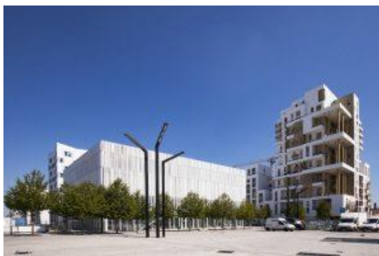
Campus Condorcet K Architectures

Paris. Centre d'études en sciences sociales du religieux, EHESS Campus Condorcet, Centre de colloques, Place du Front Populaire, Aubervilliers, Métro Front Populaire